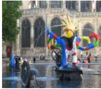
الشكل رقم (٢) صورة لتمودج نه افد (Stravinsky)