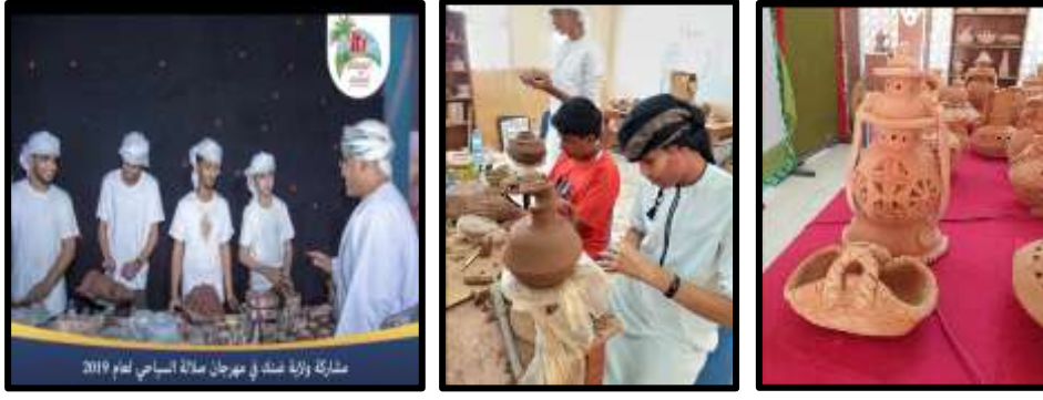
شكل رقم (٦) صور توضح نشاطات مشروع التراث الخالد

ثانيا: تجارب دولية معاصرة توظيف الفنون التشكيلية في دعم الاقتصاد الوطني: