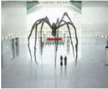
الشكل رقم (٣) صورة لتمثال 'مامان'، العنكبوت الهائل