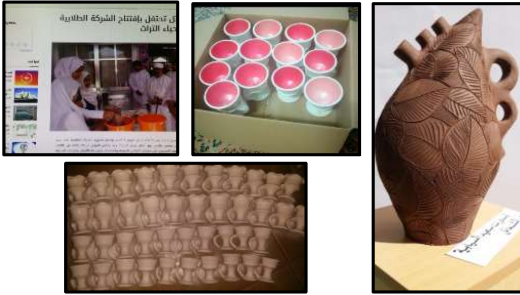
شكل رقم (٤) صور توضح نماذج من أنشطة الشركة الطلابية