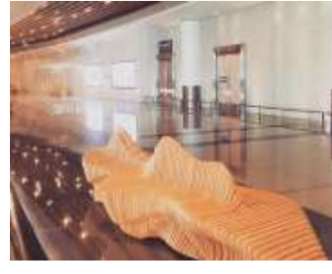
الشكل رقم (١) صورة لمقاعد النحت الخشبية الأنيقة ف.مط، مسقط